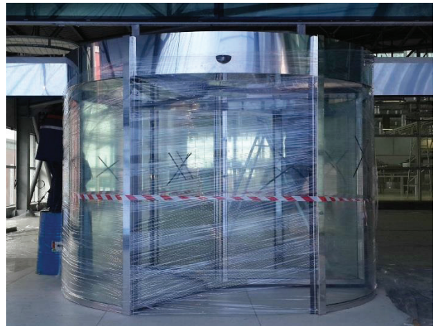
PARLAK AYNA PASLANMAZ OTOMATİK DÖNER KAPILAR