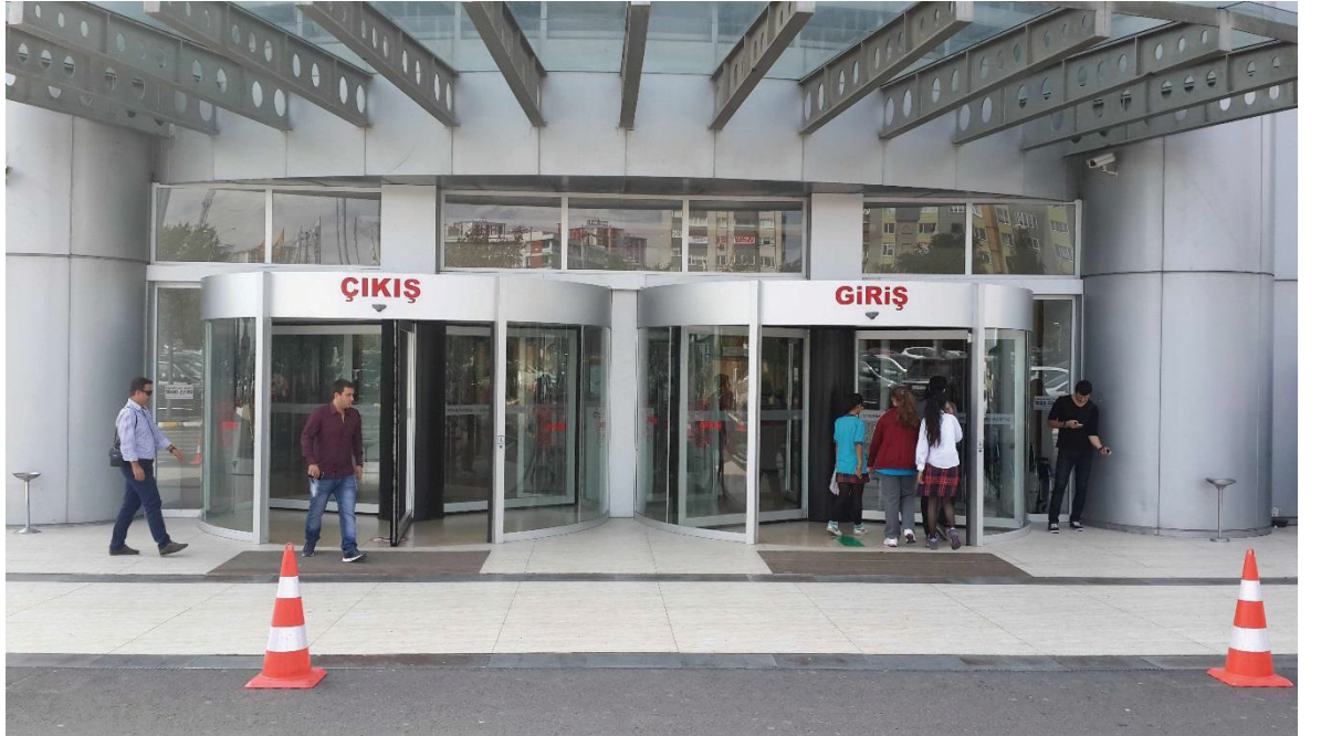
KOLON ETRAFI DÖNER OTOMATİK DÖNER KAPILAR