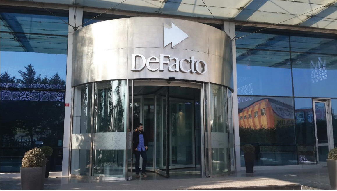
MEGA OTOMATİK DÖNER KAPILAR