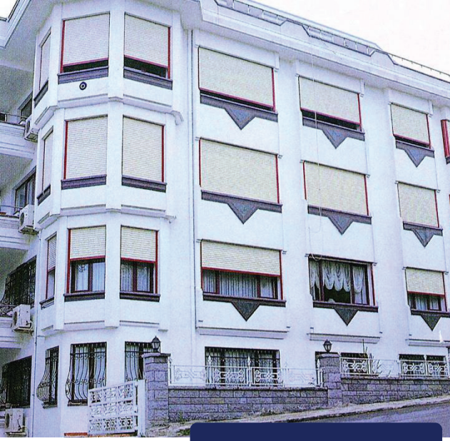
POLİRETANLI PENCERE PALETLERİ