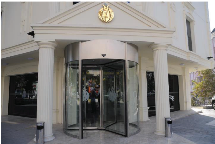
MAT PASLANMAZ OTOMATİK DÖNER KAPILAR