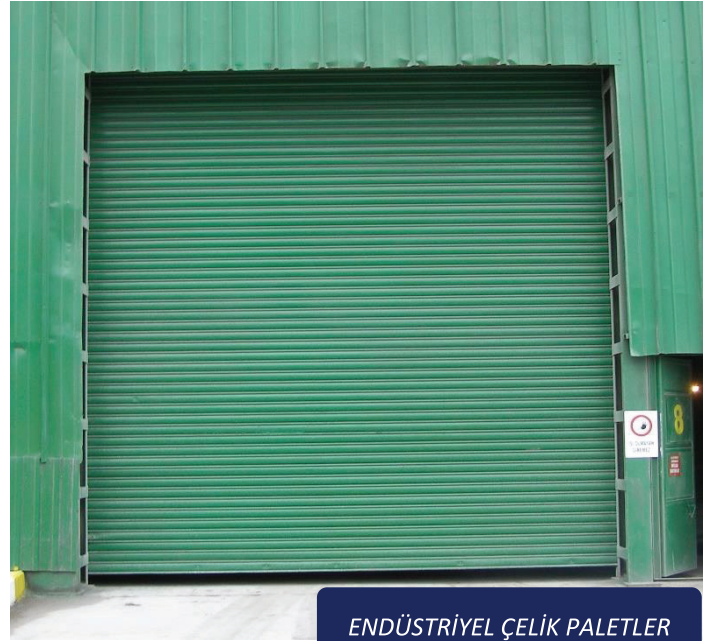
ENDÜSTRİYEL ÇELİK PALETLER