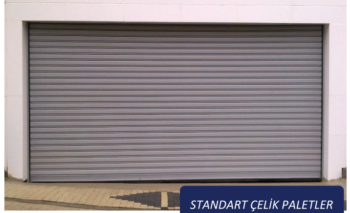
STANDART ÇELİK PALETLER