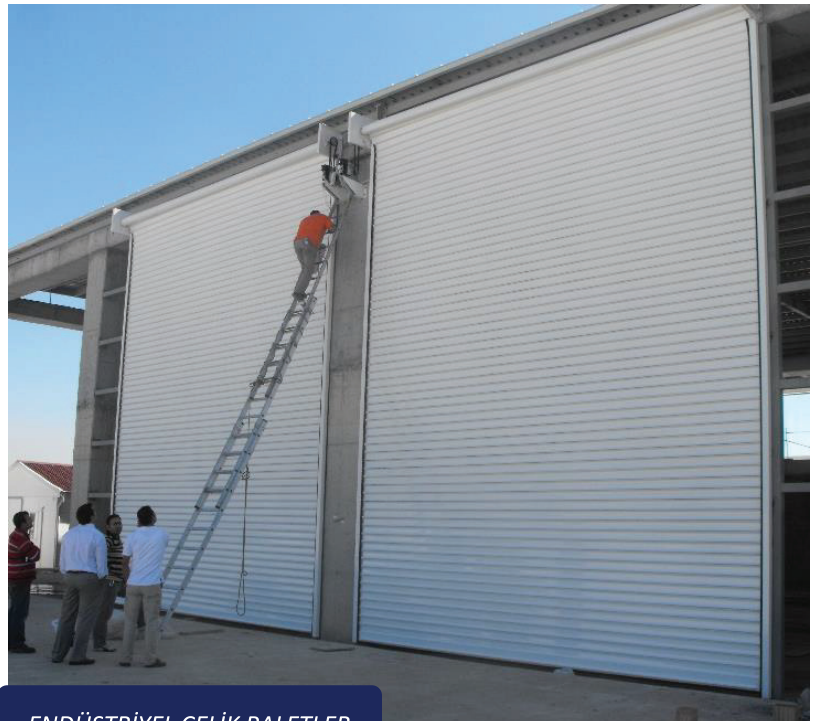
ENDÜSTRİYEL ÇELİK PALETLER